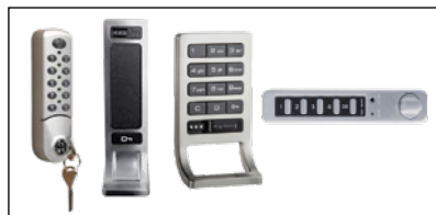
Différentes options de verrouillage